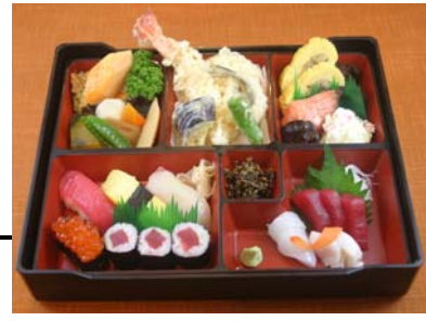
寿司入り浜定食 2900円